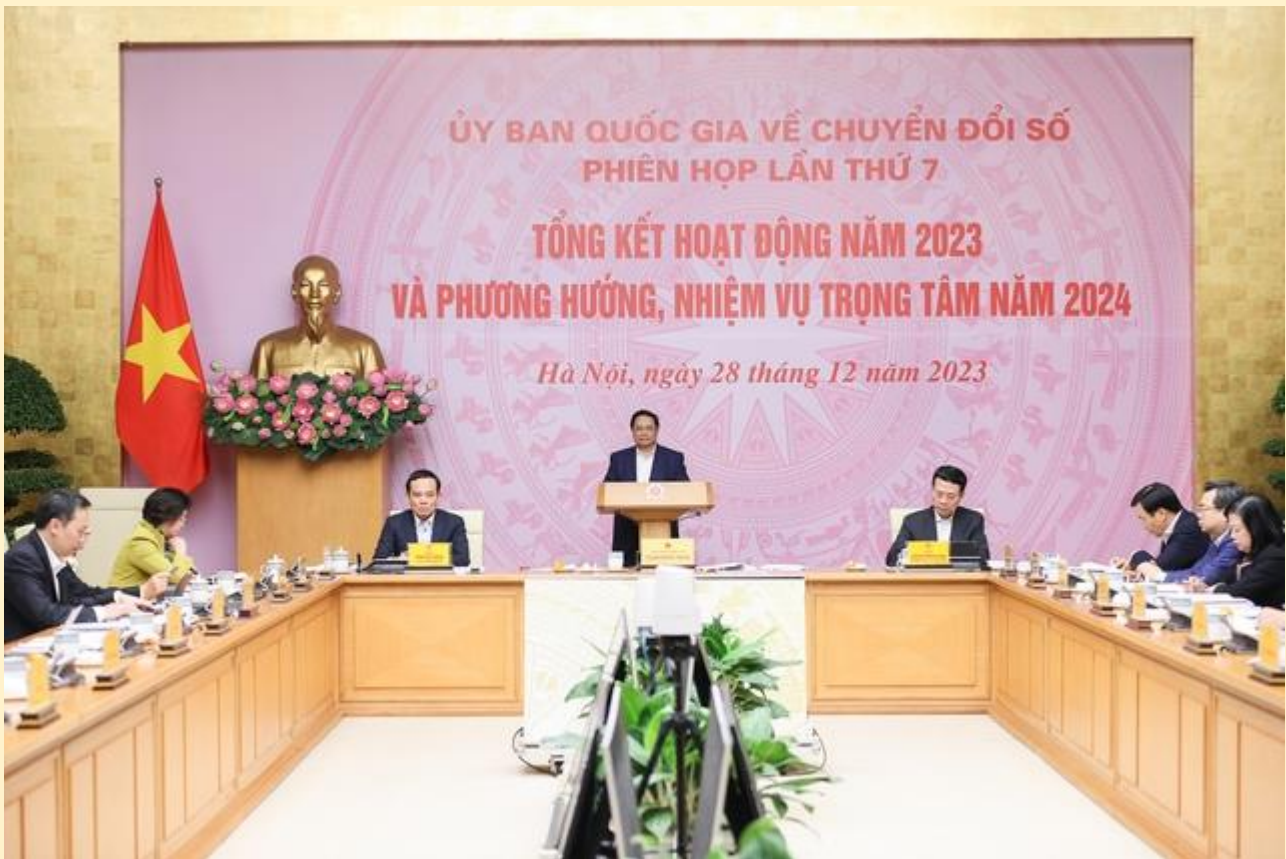
Quang cảnh Phiên họp tổng kết hoạt động năm 2023 và phương hướng, nhiệm vụ trọng tâm năm 2024 của Ủy ban Quốc gia về chuyển đổi số.

Theo đó, về nhiệm vụ, giải pháp trọng tâm năm 2024, Ủy ban Quốc gia về chuyển đổi số thống nhất tập trung vào một số nhóm nhiệm vụ trọng tâm, cụ thể: