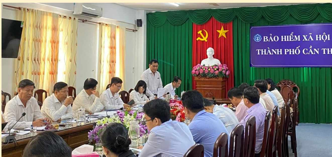
Đoàn kiểm tra CCHC thành phố năm 2023 làm việc tại Bảo hiểm xã hội thành phố