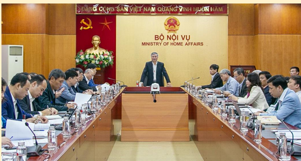
Quanh cảnh cuộc họp.

Tại cuộc họp, các thành viên Ban Chỉ đạo CCHC của Bộ đã tập trung trao đổi, đóng góp ý kiến nhằm đánh giá tình hình, kết quả công tác CCHC năm 2023, đề xuất phương hướng triển khai nhiệm vụ năm 2024; đánh giá, phân tích kết quả Chỉ số CCHC năm 2023 của Bộ Nội vụ và đề xuất giải pháp cải thiện, nâng cao Chỉ số CCHC của Bộ những năm tiếp theo.