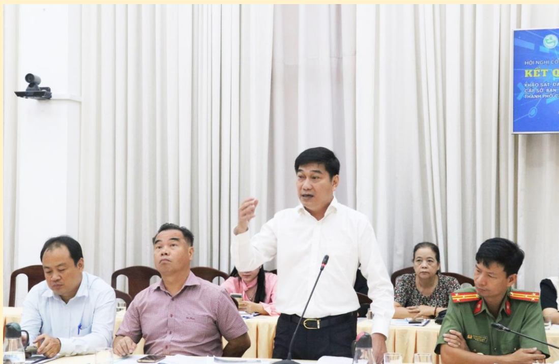
Các đại biểu phát biểu góp ý việc triển khai thực hiện Đề án DDCI thành phố trong thời gian tới.

Báo cáo DDCI của TP Cần Thơ năm 2023 cho thấy, các sở, ban, ngành đã đạt được kết quả nổi bật ở các chỉ số: hiệu quả thực hiện các văn bản pháp luật và thiết chế pháp lý, tính năng động và trách nhiệm giải trình, chất lượng dịch vụ công và bộ phận một cửa. Đồng thời, chủ động hỗ trợ kinh doanh, hỗ trợ DN; công tác xây dựng chính quyền điện tử thực hiện khá tốt. Đối với các quận, huyện, hầu hết chủ động phát huy vai trò trung tâm vùng; tính năng động, tiên phong của lãnh đạo UBND cấp huyện đạt yêu cầu chung của DN (tỷ lệ không hài lòng chỉ dưới 5%). Công tác cải cách thủ tục hành chính được thực hiện nghiêm túc, chất lượng dịch vụ công được nâng lên, hiệu quả thực hiện các văn bản pháp luật, thiết chế pháp lý và an ninh trật tự được DN đánh giá cao về tính nghiêm túc triển khai.