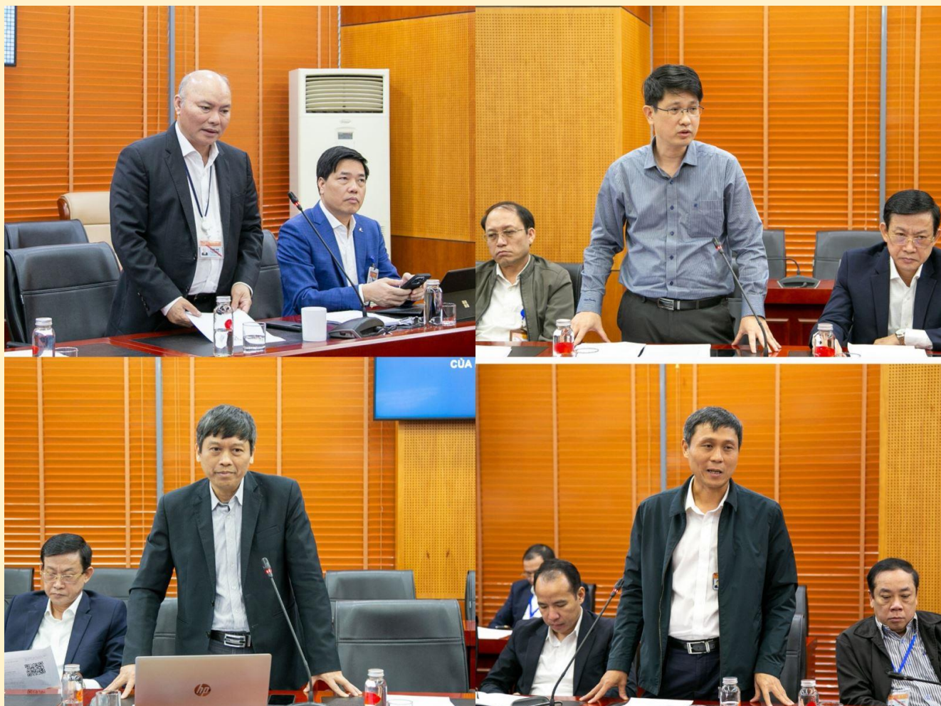
Các đại biểu tham gia đóng góp ý kiến.

Tại cuộc họp, các thành viên Ban Chỉ đạo CCHC của Bộ đã tập trung trao đổi, đóng góp ý kiến nhằm đánh giá tình hình, kết quả công tác CCHC năm 2023, đề xuất phương hướng triển khai nhiệm vụ năm 2024; đánh giá, phân tích kết quả Chỉ số CCHC năm 2023 của Bộ Nội vụ và đề xuất giải pháp cải thiện, nâng cao Chỉ số CCHC của Bộ những năm tiếp theo.